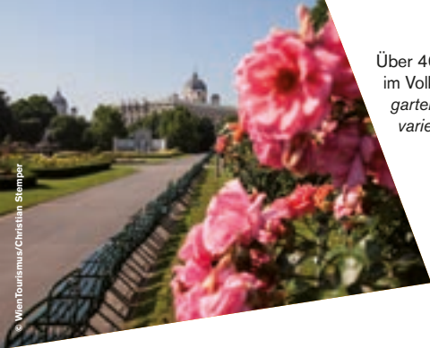
Über 400 Rosensorten blühen im Volksgarten. / The Volksgarten, where 400 different varieties of roses bloom.

Das Motto: kein Wochenende ohne Party. Die Wiener Szene , die sich um den Naschmarkt (mit der „Rosa Lila Villa“) und die Gumpendorfer Straße konzentriert, wächst kontinuierlich. Fetisch-Events und sogar eine klassische Ballveranstaltung für Schwule und Lesben ergänzen das Angebot.